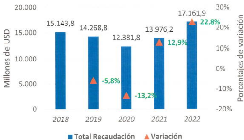
Recaudación Renta Personas Naturales* 2018-2022 Millones de USD y Porcentajes de Variación